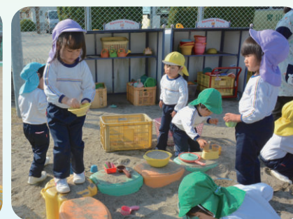
あおやまっこタイム